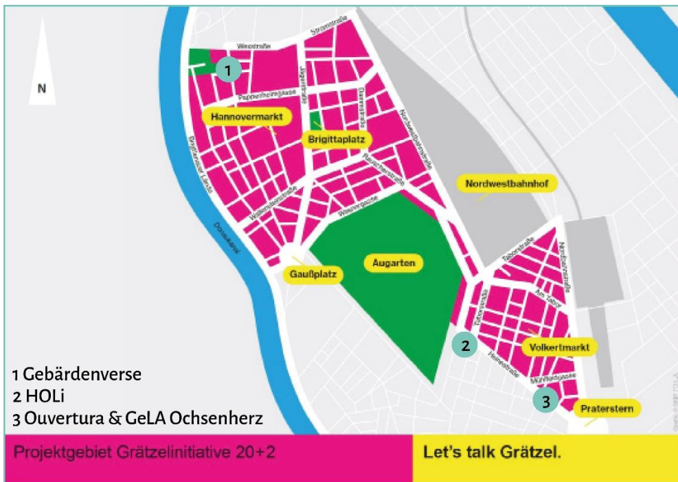
Abbildung 10 - Gebietsabgrenzung Grätzlinitiative 20+2 Cal + aktivierte Leerstände (SKIP TO L.A., bearbeitet)