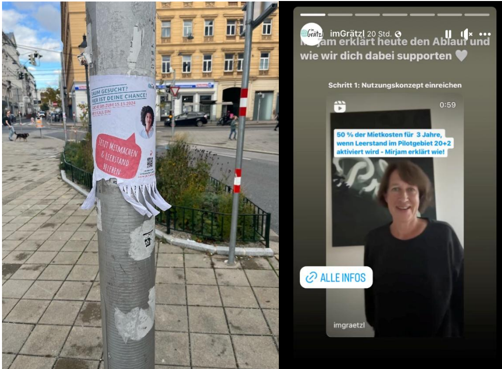
Abbildung 3 - Verbreitung Grätzlinitiative 20+2 Call via Abreißzettel und Social Media (morgenjungs und imGrätzl via Instagram)

Im Oktober und November 2024 lief der Grätzlinitiative 20+2 Call. Im Dezember wählte eine Jury, bestehend aus Vertreter:innen der Wirtschaftsagentur, WieNeu+ und der Gebietsbetreuung Stadterneuerung, zehn Gewinnerteams aus. Diese konnten die Förderung von 50 % der Mietkosten für drei Jahre (maximal 1.000 € pro Monat) abrufen, sofern sie bis Ende April einen Mietvertrag vorlegten. Für Teams, die bereits kurz vor einer Anmietung standen, jedoch noch Detailfragen vor Vertragsunterzeichnung klären mussten, wurde die Frist bis Ende Juni verlängert.