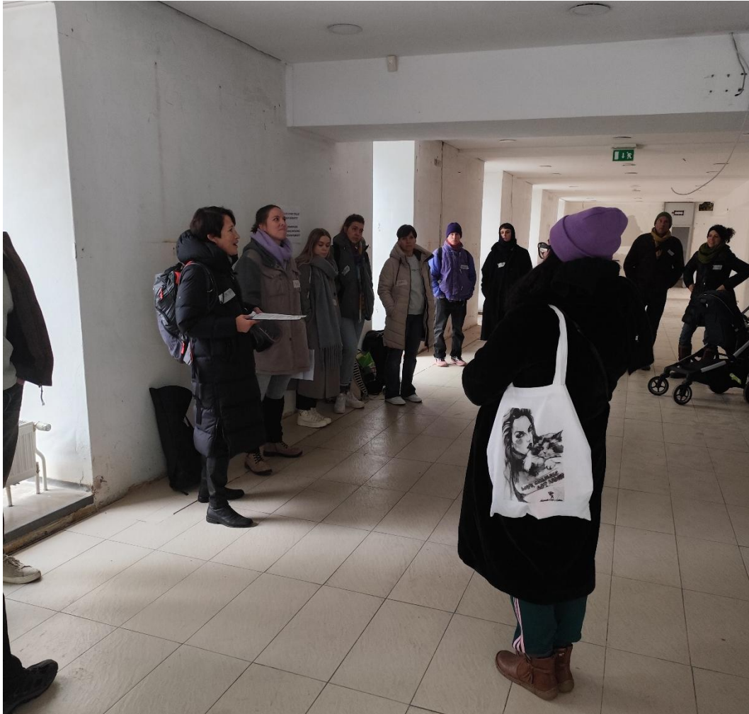
Abbildung 6 - Vernetzungsevent ViertelFonds 1 Call (StadtLABOR)

Das qualifizierte Team wurde bei der Vorbereitung und Durchführung der Crowdfunding Kampagne sowie grundsätzlich beim Anmietprozess begleitet. Die 1.500 € aus dem ViertelFonds flossen bei Erreichen von 30 % des Crowdfunding-Mindestziels und mindestens 30 Unterstützungen direkt in die Crowdfunding Kampagne. Nach dem erfolgreichen Abschluss der Kampagne wurden sie inkl. der anderen Unterstützungen ausbezahlt. Ein weiteres eingereichtes Projekt entstand beim crowd2raum-Vernetzungstreffen Mitte Jänner 2025 während des Calls. Das Team wurde mit Beratungen für eine Crowdfunding Kampagne zur Aktivierung eines Leerstands außerhalb des Pilotgebiets unterstützt, startete aber bis Projektende noch keine Kampagne.