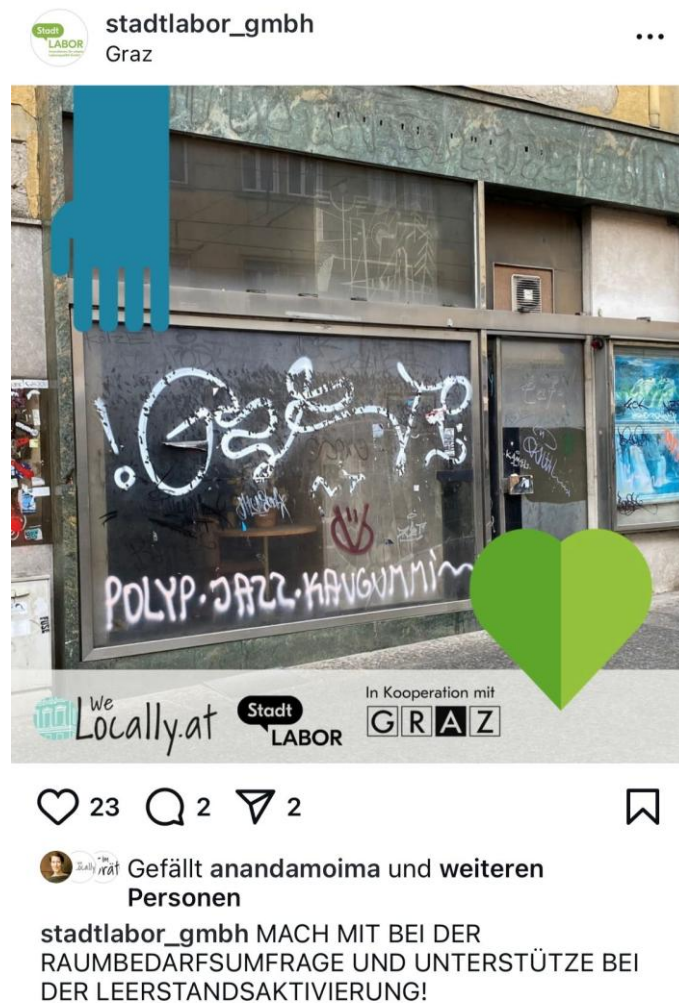
Abbildung 1 - Verbreitung der Raumbedarfsumfrage (StadtLABOR via Instagram)