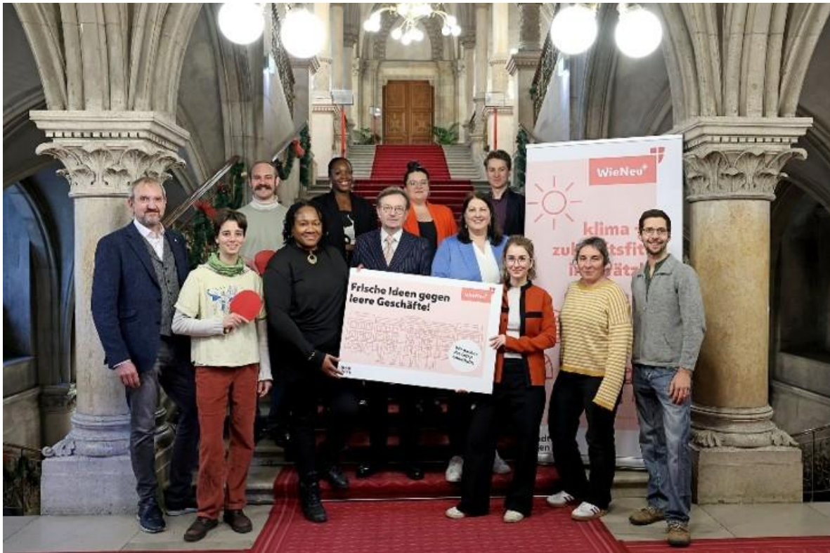
Abbildung 11 - Gewinner-Teams Grätzlinitiative 20+2 Call