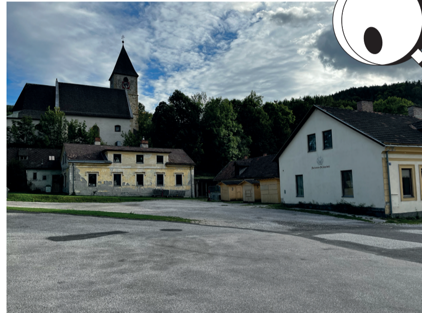
Ortskern Payerbach © HARDDECOR ARCHITEKTUR

Als Teil der UNESCO-Weltkulturerbe-Region Semmering mit außergewöhnlichem baukulturellem Kapital, in der Baukultur als Ressource für Identität, Lebensqualität und regionale Wertschöpfung verstanden wird, besteht die Notwendigkeit, dieses Potenzial gezielt in zukunftsfähige, sozial inklusive und ökologisch nachhaltige Strukturen im Ortskern zu überführen.